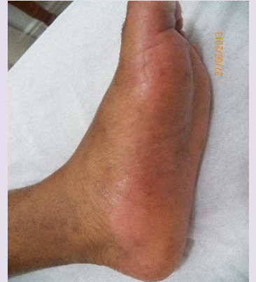
DEPOIS | PÉ ESQUERDO E DIREITO