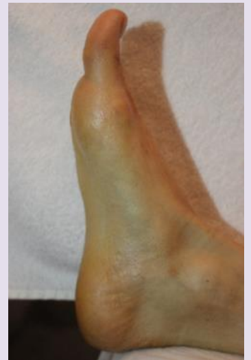
DEPOIS | PÉ ESQUERDO E DIREITO