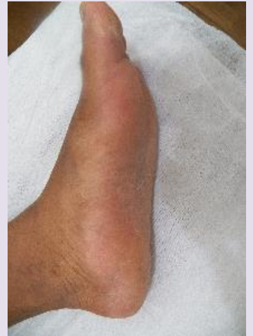
ANTES | PÉ ESQUERDO E DIREITO