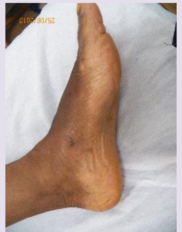
DEPOIS | PÉ ESQUERDO E DIREITO