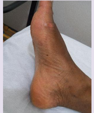
ANTES | PÉ ESQUERDO E DIREITO